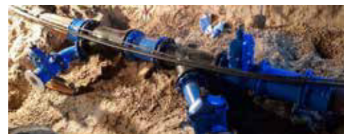
Detailbild: Armaturen und Schieber der neuen Einbindung in die Abwasserdruckleitung

Davon werden gut 86 % der Einwohner (EW) profitieren.