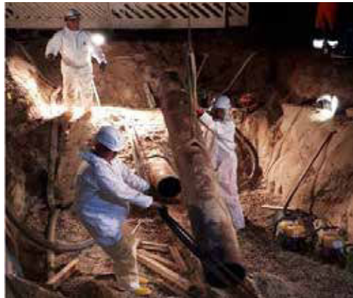
Nachts, wenn alles schläft, nimmt der Zweckverband unbemerkt die Zulaufleitung zur Kläranlage und alle Schmutzwasserpumpwerke außer Betrieb. Diese Baumaßnahme ist Teil des Großbauprojekts „Bau einer 2. Abwasserdruckleitung“.

Der uneingeschränkte Bestätigungsvermerk wurde erteilt – und Verbandsvorsteher Sebastian Busse einstimmig von den Mitgliedsvertretern entlastet.